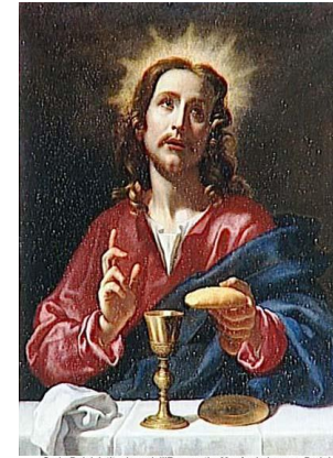
Carlo Dolci, Istituzione dell'Eucarestia, Musée du Louvre, Paris